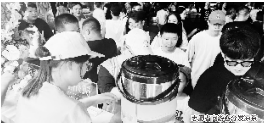
志愿者向游客分发凉茶