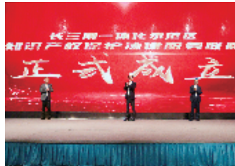
长三角一体化示范区知识产权保护法律服务联盟成立

行政保护与司法保护、法务赋能与警务赋能的业务中台,整合示范区知识产权保护法律服务联盟、跨域营商环境制度谏评联系点、公共法律服务点、嘉善县知识产权纠纷调解委员会、示范区涉外法律服务工作站,集成“易公正”、善企法律“云诊室”,建立合规指导、对外贸易化解风险指导及风险预警等“一站式”综合服务体系。