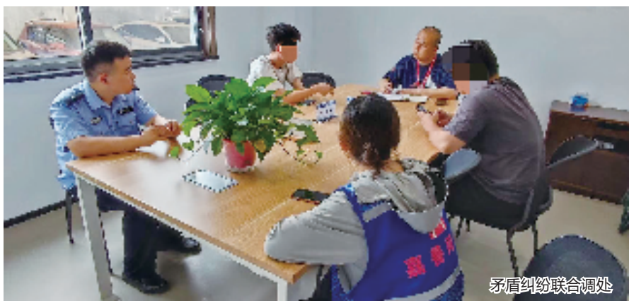
矛盾纠纷联合调处

在健全完善人民调解组织网络的基础上,嘉善县司法局联合相关职能部门先后指导建立医调、交调、校调、物调等12个行业性、专业性调解组织,织好横向调解网