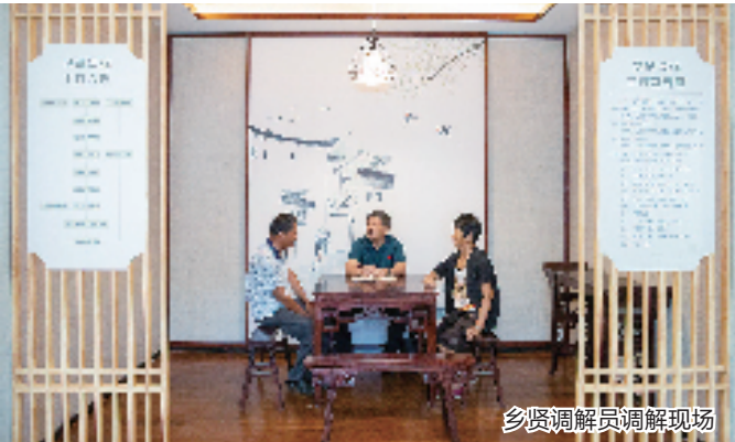
乡贤调解员调解现场