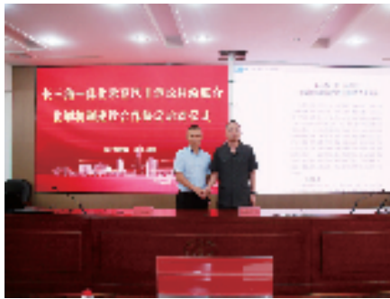
签署《长三角一体化示范区非诉讼纠纷联合化解机制建设合作协议》

三角一体化示范区的核心区域,企业间贸易往来频繁,买卖合同、劳动争议、民间借贷等纠纷时有发生。嘉善县司法局一直致力于法治化营商环境建设,鼓励企事业单位成立调委会,推动企事业单位内部自助调解就地化解纠纷,目前已成立28个企事业单位调委会。