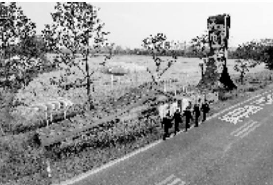
“生态警长”带队巡逻