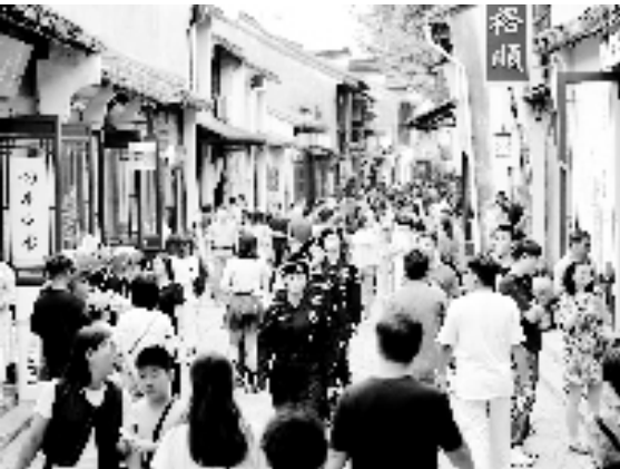
护航古镇旅游经济发展