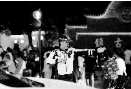
现场疏导古镇交通