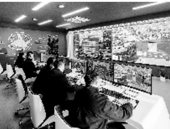
全市首个“未来派出所”在石淙落地

全市首个“未来派出所”在石淙落地;5个派出所建成“未来案管室”,探索“芯案管”模式;深化“交所融合”机制,有力破解交通治理难题,“交通态势”“云舱数治”“主防指数”“法智云端”等一系列场景落地应用;建成全省首个生态警务联盟、打造全省首个高校社会治理联动工作站…… 用奔跑守护平安,以奋斗点亮未来。2023年,湖州市公安局南浔区分局聚焦“市县主战、派出所主防、全警主训”,坚持守正创新,持续深化“三大警务”和“139体系”,加快打造具有南浔辨识度的现代警务新体系,圆满完成杭州亚(残)运会等重大活动安保任务,刑事、治安、黄赌、纠纷、打架斗殴类警情同比分别下降 14.99%、16.64%、15.13%、39.12%、26.86%,全区持续保持命案“零发生”。