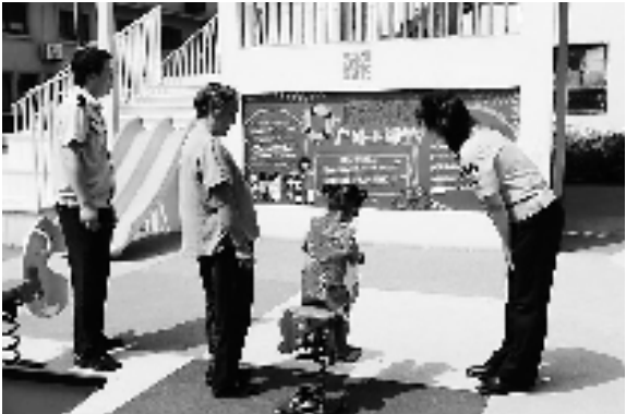
写着防溺水小知识的儿童乐园

置情况等。 普法宣传之风已吹遍上叶村每个角落。当地精心策划反诈、安全防范、防溺水等宣传,融入村未来农场、口袋公园等环境中;开设“阴阳警官直播间”,用通