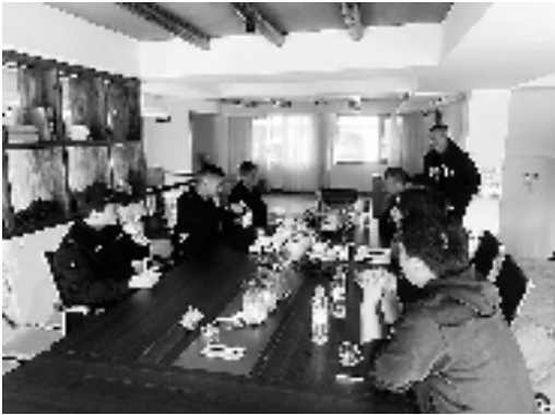
民警与“烟霞义警”正在调解纠纷

近年来,仙居县为抓好平安建设,以村社网格这一最小治理单元为突破口,开展“和合平安村社”创建行动,打造平安幸福家园,白塔镇上叶村就是典型代表。 当地毗邻神仙居旅游度假区,离神仙居、景星岩、高迁古民居三大景区和诸永、台金两大高速出口均不到1公里。不少村民看见商机,在村里开起了民宿。 为更好维护上叶村的治安,白塔派出所和村民宿协会共同牵头,成立了“烟霞义警”民宿联盟,让村民、商户作为主人翁,参与巡逻防范、隐患排查、纠纷调处。 前不久,民警与“烟霞义警”在村里巡逻时,发现一位老人与他人因琐事争吵。推搡中,对方不小心把老人推倒在地。社区民警与义警将双方带到调解室调解,最终,对方向老人道歉并赔偿医疗费。 近年来,白塔派出所还联合其他部门,对上叶村民宿开展“清风民宿”评比活动,涉及平安指数、卫生指数以及服务指数,其中,平安指数包括民宿是否存在黄赌毒情况、开展反诈宣传情况、游客纠纷靠前处