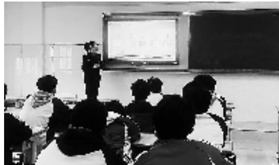
民警正在给同学们上课

“同学们,今天我们要讲的是《面对校园霸凌行为时我们该怎么做》。首先,让我们了解一下什么是校园霸凌行为,校园霸凌行为有什么特点……”站在讲台上的民警正在上法治宣传教育课,台下的同学们抬起头认真听着。 这是“仙苗之家”教育体验营里的一幕。