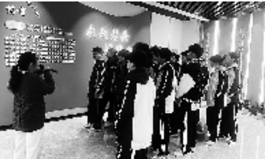
学生参观永安老兵荣军展厅

2023年,仙居县树立“仙苗学堂”品牌,整合教育、公安、民政、团委、妇联等部门力量,筛选表现不佳、行为不良或存在厌学思想的学生,组建帮扶团队,举办了5期“仙苗之家”教育体验营,参学学生共104人。 “仙苗之家”教学形式不局限于课堂,学员们会在带领下做破冰团体小游戏,参观检察院教育基地、永