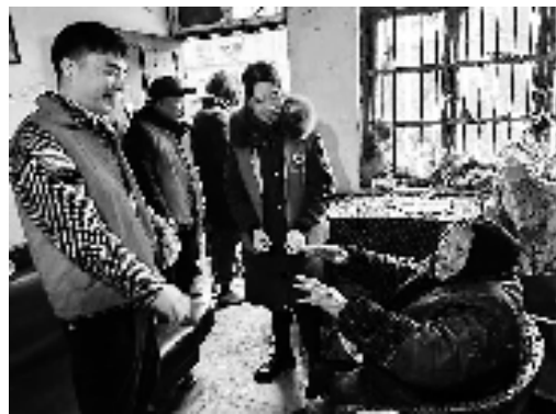
开展“爱心敲门”志愿服务

志愿服务500余次。接下来,该村党支部将持续推进“爱心敲门”志愿活动,不断扩大志愿者队伍,进一步做实做细群众工作。