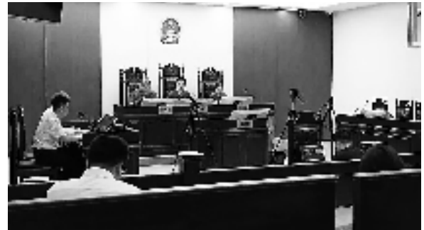
审理破产清算案件

近年来,新区法庭不断创新司法服务举措,去年累计受理民事诉讼案件864件,结案852件;成功调处矛盾纠纷前调解案件298件,诉前化解成功率67.3%,为当事人挽回经济损失4813万元。