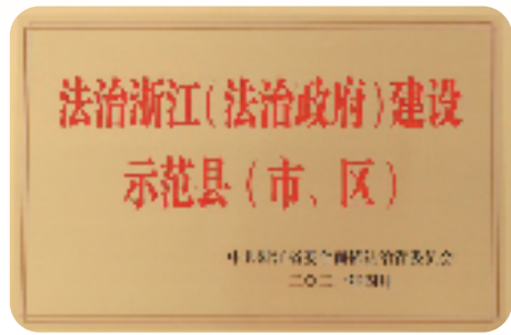
2021年,临安区获评法治浙江(法治政府)建设示范区。