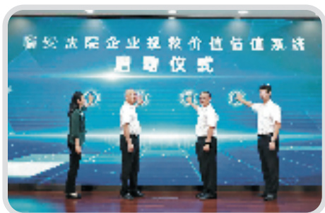
临安区创新打造企业挽救价值估值系统,助力破产企业脱困和诚信企业家重生。