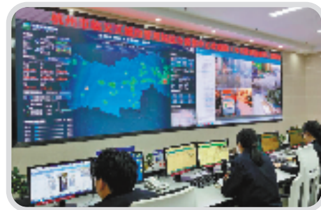
临安区集成建筑工地监管“一件事”应用,解决建筑工地涉及到的安全生产、扬尘治理、污水排放、噪声治理等问题。