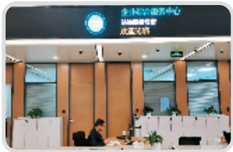
临安区企业法治服务专区依托区企业综合服务中心,为企业提供各类法治服务。