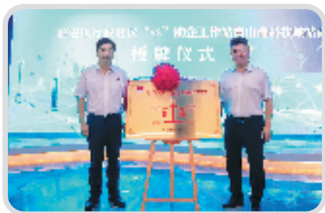
临安区设立行政复议“5S”助企工作站,推进行政复议“助企利民”专项行动。

社会治理效能全面提升。深化共享法庭建设,参与起草省级地方标准,完善矛盾纠纷多元化解体系,推动市场化解纷,基层治理体系和治理能力现代化水平显著提升。推进公民法治素养提升行动,构建大普法格局,获评全国民主法治示范村3个、省级民主法治村(社区)51个,崇法向善的法治环境更加完善。