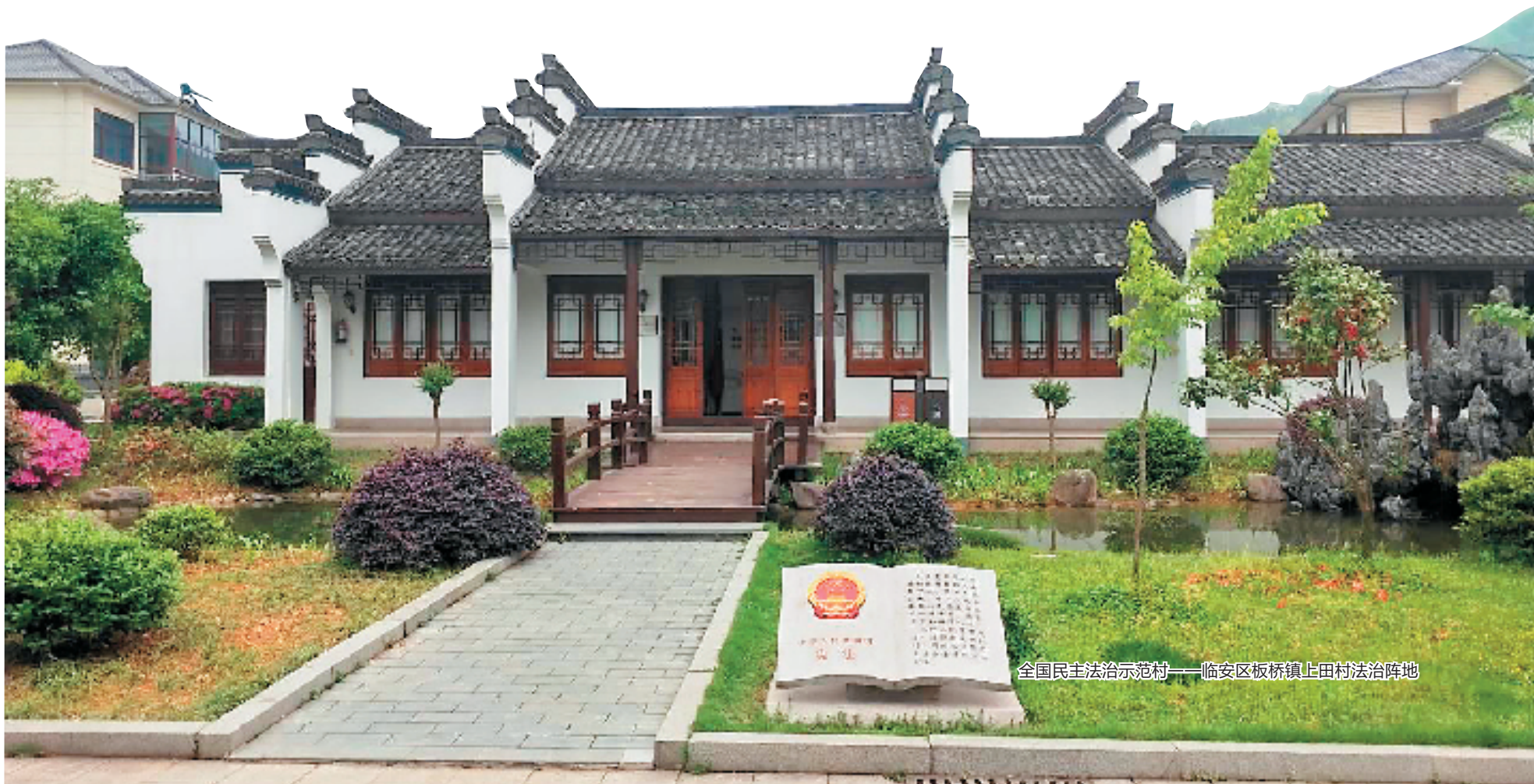
全国民主法治示范村——临安区板桥镇上田村法治阵地