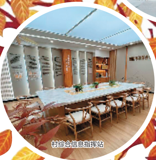
村综合信息指挥站

“现在我们村环境好了,村口就是地铁站,我把闲置多年的老房子腾出来,准备打理成意大利风味餐厅。”一位返乡村民乐滋滋地说。