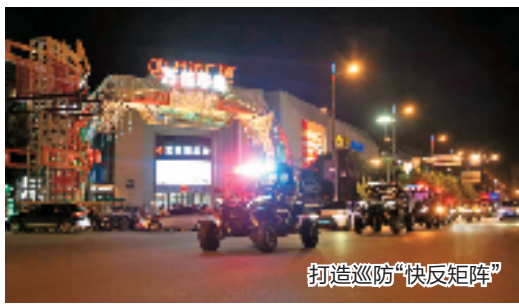
打造巡防“快反矩阵”

温州市龙湾区多措并举、多管齐下,以政法工作的高质量发展促进经济社会高质量发展,让平安龙湾的成色更足、底色更靓。