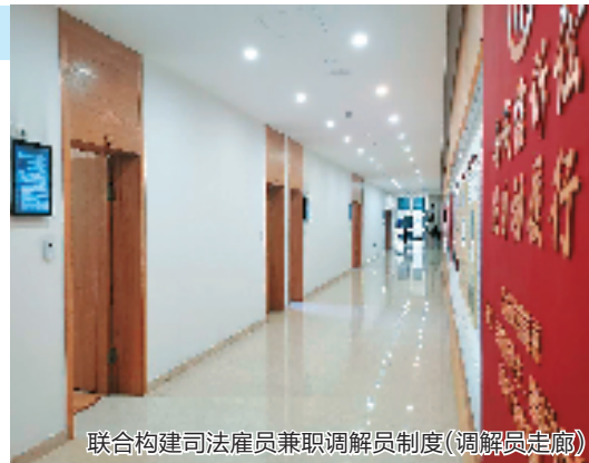
联合构建司法雇员兼职调解员制度(调解员走廊)

在案多人少矛盾下，各类纠纷化解工作如何更好开展？如何制度性解决诉源治理的难点痛点堵点？瓯海区政法单位坚持和发展新时代“枫桥经验”，主动融入社会治理大格局，加强一站式多元解纷体系建设，创新矛盾纠纷排查处置“双循环”模式和非警务事项全链条分流路径，相关经验做法在省