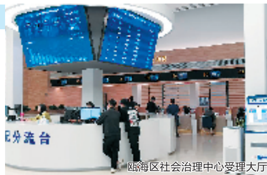
瓯海区社会治理中心受理大厅

近年来，瓯海区聚焦矛盾纠纷化解健全多中心调解格局，多方调处化解，及时启动心理疏导机制，由区“心福工坊”指派经验丰富的心理咨询师为受害者家属提供心理健康疏导和干预，并根据瓯海区“燎