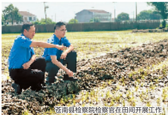
苍南县检察院检察官在田间开展工作

近年来,苍南县持续探索农村治安治理“法治保障、德治先导、自治强基”模式,走出了一条平安乡村建设与乡村振兴、农村经济社会发展良性循环的路子。