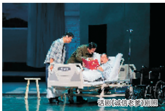
话剧《诚信老爹》剧照

为进一步激发德治能量,当地还出台了《苍南县道德模范优惠待遇保障暂行办法》,为道德模范等七大类善行义举者提供包括政治、经济、社保在内的