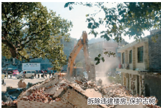
拆除违建楼房,保护古树