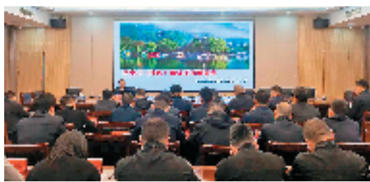
2024年3月,临海市召开全市平安村(社区)建设专题部署会。

单丝不成线,独木不成林。在探寻平安建设“更优解”的过程中,临海群众的首创精神得到充分尊重。古城街道鹿城社区“夕阳红”巡逻队、杜桥“义警”、尤溪“和合三姊妹”特色品牌、河头镇殿前村“议事协商”……该市坚持和发展新时代“枫桥经验”实践案例和示范成果更具辨识度。