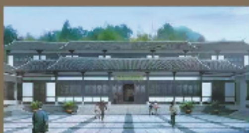
中共浙江一大陈列馆