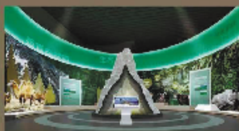
新疆托木尔生态博物馆