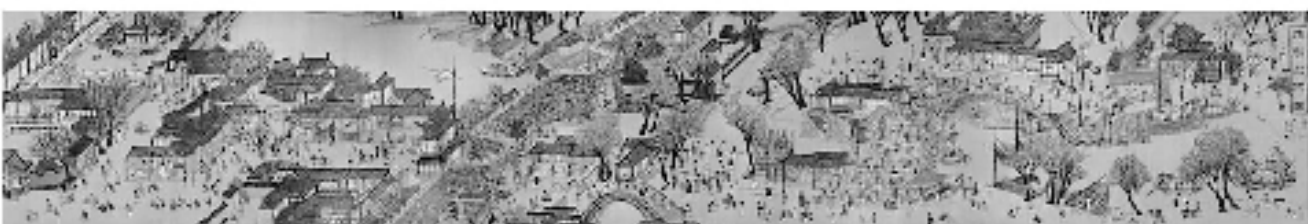
瓜子画《清明上河图》