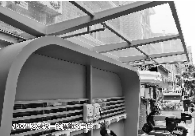
小区里安装统一的智能充电桩