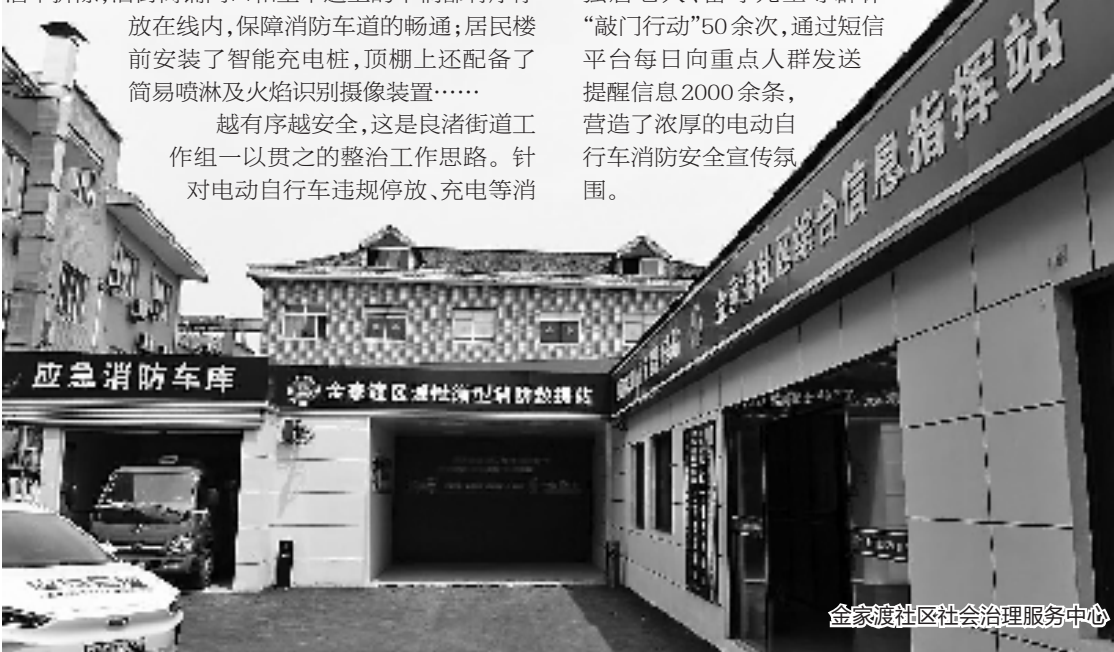
金家渡社区社会治理服务中心

据统计,自整治工作开展以来,街道、社区已开展电动自行车消防安全宣传267次,张贴、发放火灾案例警示、电动自行车消防安全知识宣传海报2324份,发动网格员、志愿者深入开展独居老人、留守儿童等群体“敲门行动”50余次,通过短信平台每日向重点人群发送提醒信息2000余条,营造了浓厚的电动自行车消防安全宣传氛围。