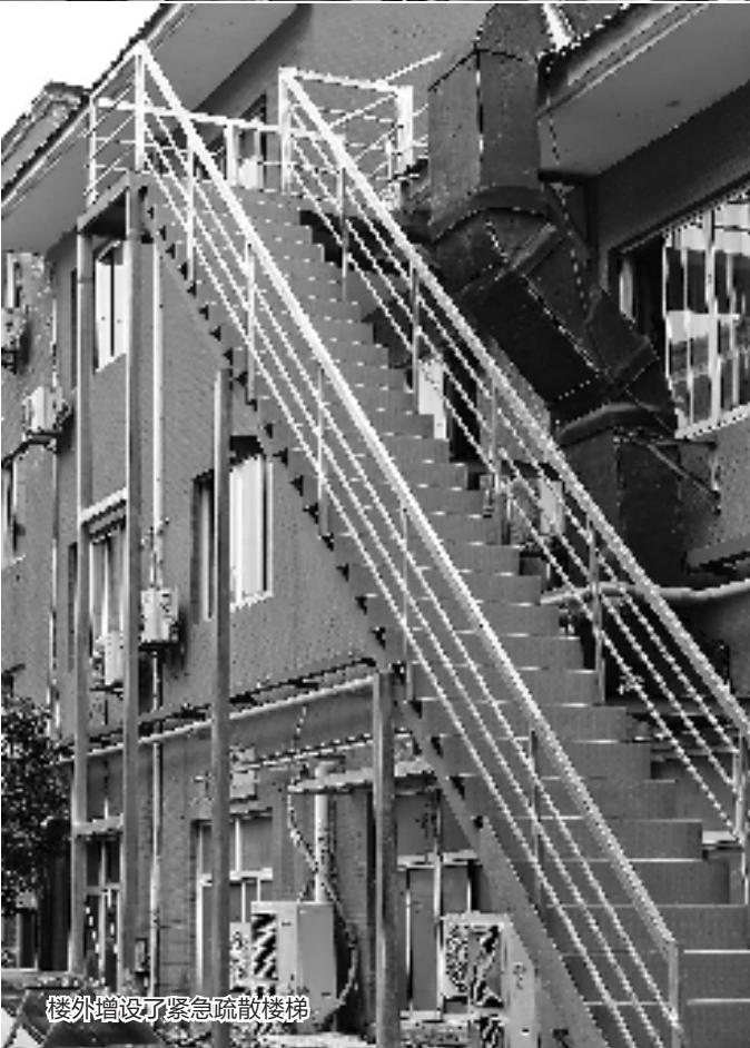
楼外增设了紧急疏散楼梯