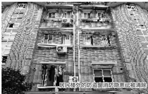
居民楼外的防盗窗消防隐患已被清除