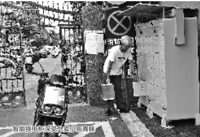
智能换电柜深受外卖小哥青睐

消防安全是一项重要的民生工程,事关人民群众生命财产安全、经济高质量发展和社会大局稳定。杭州余杭良渚街道以金家渡区块为突破口,多管齐下,通过“三根线”扎实开展消防安全隐患综合治理,全力破解电动自行车违规停放、违规充电等难点问题,着力提升辖区火灾防控水平,有效预防和遏制火灾事故的发生。