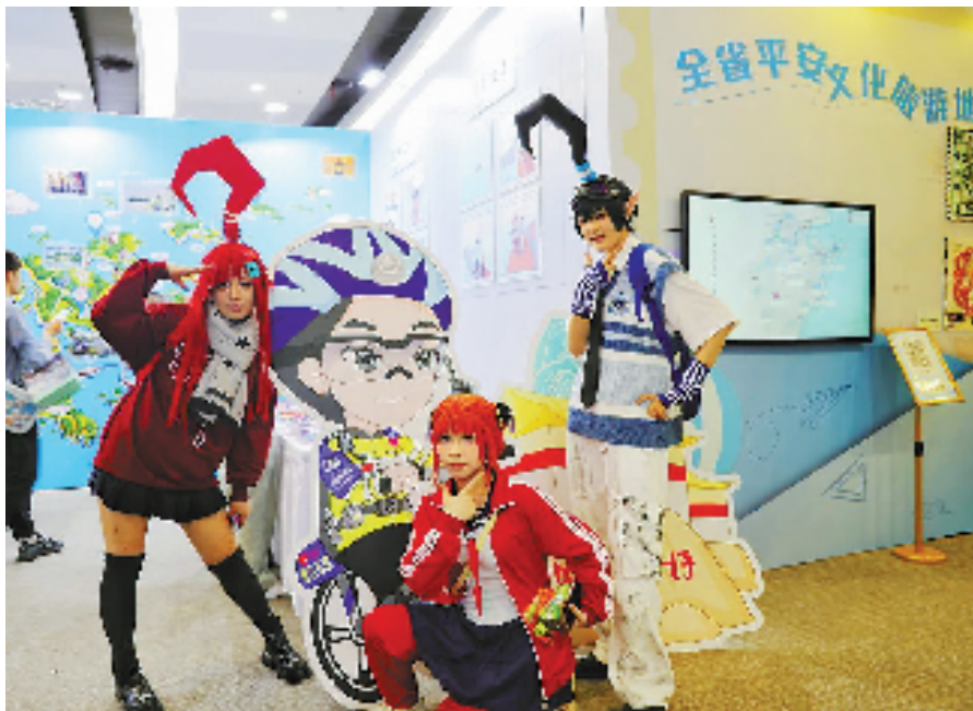
动漫达人在“浙里平安”展区开心合影

除了琳琅满目的展品,展区内还有寻找平安口令、集章打卡等丰富的互动活动。展区以“平安浙江一日游”为互动主线,设置了“浙里无邪动漫馆”“平安旅游地图”“刑不刑旅途”“不能买便利店”等多个互动打卡点,只要找到平安口令并完成平安问答,就能把精美的平安文创礼品带回家。玩游戏、学知识、抽礼物,整个展区吸引了众多动漫迷热情打卡,大朋友、小朋友都玩得大亦乐乎。