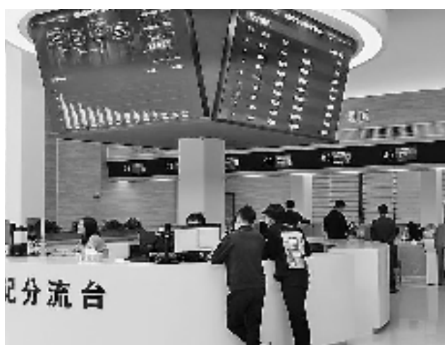
瓯海区社会治理中心受理大厅

在案多人少矛盾下，各类纠纷化解工作如何更好开展？如何制度性解决诉源治理的难点痛点堵点？瓯海区政法单位坚持和发展新时代“枫桥经验”，主动融入社会治理大格局，加强一站式多元解纷体系建设，创新矛盾纠纷排查处置“双循环”模式和非警务事项全链条分流路径，相关工作经验做法在省级现场会作典型发言。瓯海区法院、司法局联合构建司法雇员兼职调解员制度，有效壮大调解员队伍，全年共化解纠纷940起，切实提升调解工作质效。