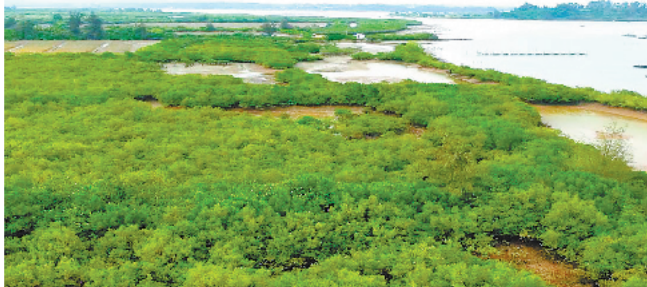
修复补种后的澄迈花场湾红树林