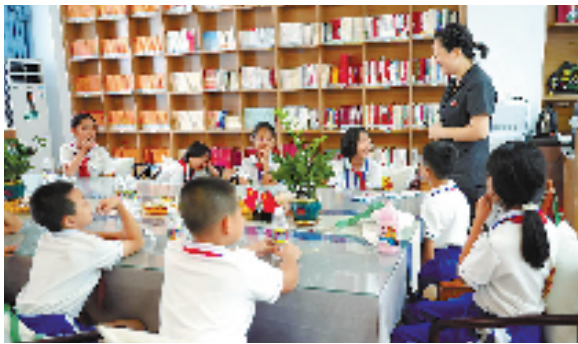
五指山市人民法院依托青少年法治教育实践基地提升普法效能