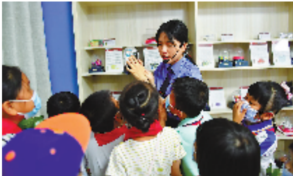
琼海市检察院检察干警开展法治宣传教育