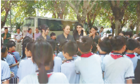
海南省三亚市中级人民法院开展“花蕾心声——送法进校园”活动

与此同时,五指山市法院依法履行审判职能,以“办案+说法”“一对一”帮教等机制,全面加强未成年人司法保护,守护未成年人多彩青春。近日,五指山市第一小学的30名学生走进五指山市法院青少年法治教育基地,通过参观法庭、观看普法宣传片和面对面交流的方式“零距离”了解法院工作,“沉浸式”接受法治教育,这是该院开展“护苗”专项行动的一个缩影。此外,该院还依托“党群联络员”机制,将“法官进网格”工作与“护苗”专项行动相融合,通过9名法官、20名法官助理和15名书记员主动对接联系全市73个村(居)委会,构建覆盖五指山市各个乡镇的司法服务“网格辐射”,将未成年人审判触角延伸至社会“末梢”,有效开展未成年人权益保护和犯罪预防工作。