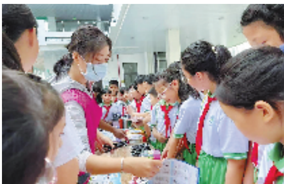
海南省三亚市吉阳区工作人员深入校园开展普法宣传活动