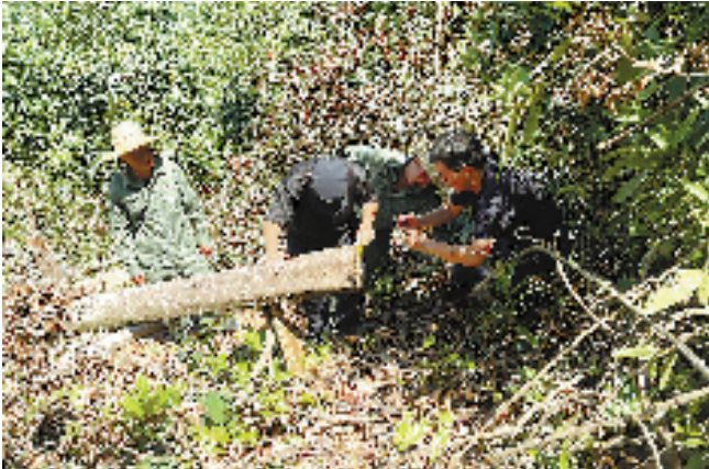
海南省公安厅森林公安局鹦哥岭保护区分局民警在案发现场取证