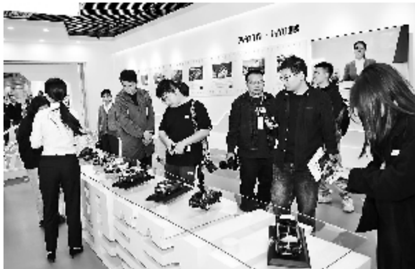
记者团在潘火街道“汽车大道”内的新时代法治实践站采访

“法管家”还积极做好民事纠纷的调解工作,把矛盾化解在萌芽状态。此前,园区内某店主与房东就租金问题产生矛