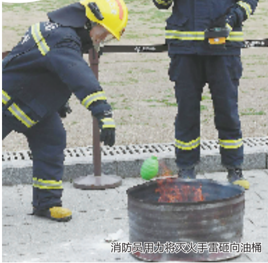
消防员用力将灭火手雷砸向油桶