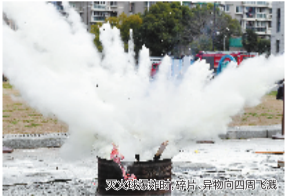
灭火球爆炸时,碎片、异物向四周飞溅