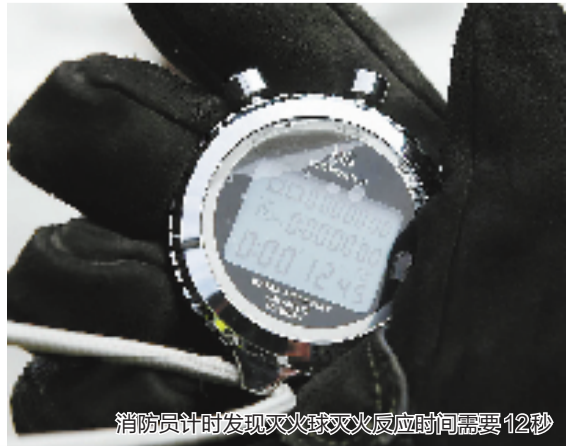
消防员计时发现灭火球灭火反应时间需要12秒