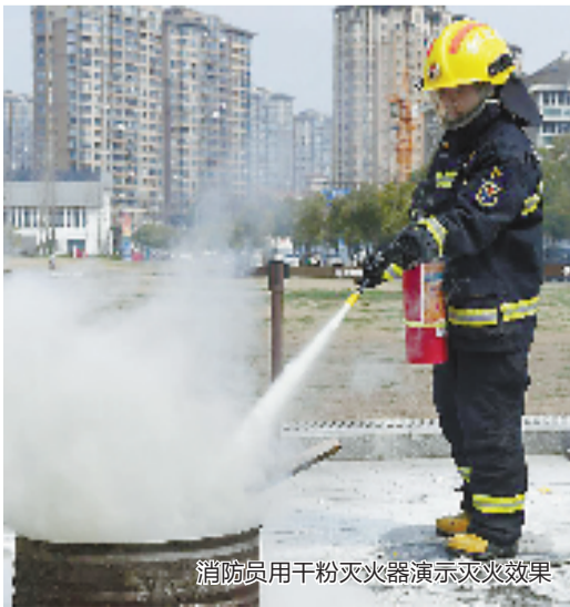
消防员用干粉灭火器演示灭火效果

实验最后,为了展示常规灭火产品的灭火效果,消防员分别用干粉灭火器和水基型灭火器进行油桶灭火。与前几次实验不同的是,除干粉灭火器灭火时现场产生了大量白色干粉粉末飘散情况外,这2款灭火产品的灭火效果都较好,而且操作简单,只需站到火场的上风口,拔掉瓶体上的插销后,用手捏住软管,对着火焰根部进行喷射,直至火势熄灭即可。 消防员提醒,大家选购灭火产品时,一定要到正规的消防器材销售单位购买,查看消防灭火产品表面及包装上是否有清晰、耐久的标志,认准3C认证标志,或登录“中国消防产品信息网”查询消防产品生产企业、产品、型号及有关情况,也可以通过扫描消防产品标注的QS码鉴别真伪。