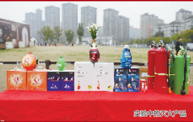
实验中的灭火产品

随着人们消防安全意识的提高,不少消费者会选购一些家用消防灭火器材以备不时之需。近来,一些造型奇特的灭火球、灭火宝、灭火手雷、灭火花瓶等网红灭火产品越来越受到消费者的青睐。这些五花八门的新型灭火产品,真的能安全有效地扑灭火势吗? 3月11日上午,杭州市消防救援支队在余杭区闲林街道进行了网红消防产品测试实验,结果发现:网红灭火神器并不靠谱。 考虑到实验测试的各款网红灭火产品在灭火过程中可能存在不确定因素,消防员选择了一块较为空旷的场地,并用一米线围起了约30平方米的实验区域,以确保安全。