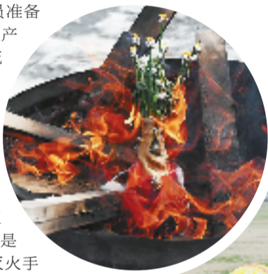
灭火花瓶对油桶火势没有作用

实验继续,这次消防员准备了2款造型奇特的网红灭火产品——灭火手雷和灭火花瓶。两款产品也属于“三无”产品,但依然标有瞬间灭火的宣传说明。 为体现产品的灭火效果,消防员待油桶内温度超过500℃,先按灭火手雷的操作提示,大力将灭火手雷砸向油桶内,但可能是砸的位置和角度等原因,灭火手雷的瓶体没有碎裂,没能起到灭火效果。消防员又拿来一个灭火手雷重复上述操作,才将油桶内的火扑灭。 消防员使用灭火花瓶进行灭火实验时发现,灭火花瓶投入后,油桶内的火势没有任何变化。随着火将灭火花瓶慢慢熔化,灭火花瓶内的液体灭火剂也仅仅喷出了约1厘米的距离,对于抑制油桶内的火势几乎没有作用。 消防员说,火灾初期是扑救的最佳时机,而灭火手雷的投掷力度和精准性很难把握,灭火花瓶则完全没有灭火效果,这将会错失扑救火灾的时机,导致火势蔓延,损失扩大。