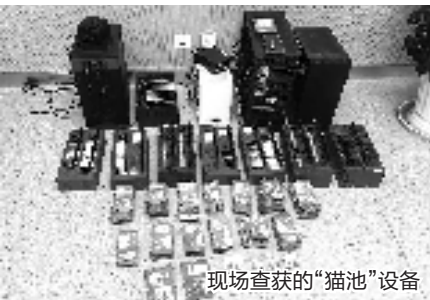
现场查获的“猫池”设备

网络谣言,每个人都可能遇到过。但谣言是怎么来的?发布会上,几个案例让人哭笑不得。