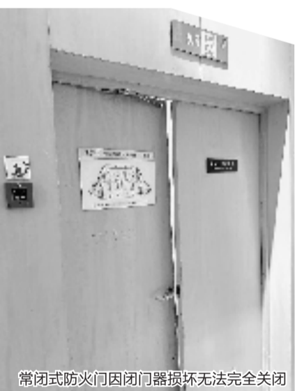
常闭式防火门因闭门器损坏无法完全关闭