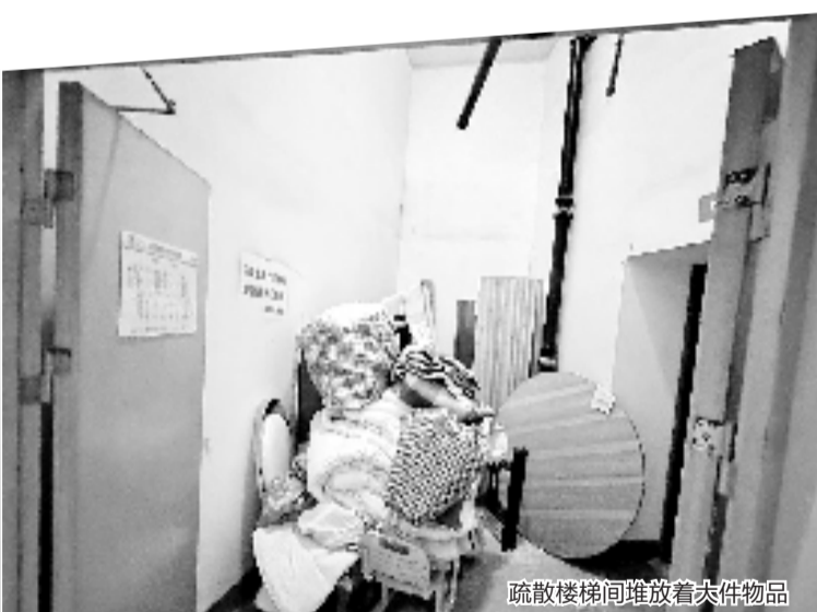
疏散楼梯间堆放着大件物品