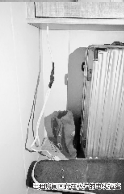
出租房间内存存在私拉的电线插座

检查出租房配备的灭火器和“消防四件套”能否正常使用，“对于损坏的设施设备，维修工程已经启动。”