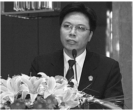
临海市人民法院院长 李本浪