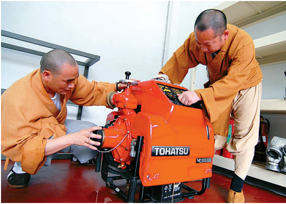
消防设备也是他们的宝贝