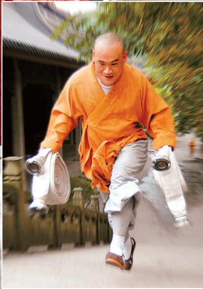
负重登高跑,速度不一般