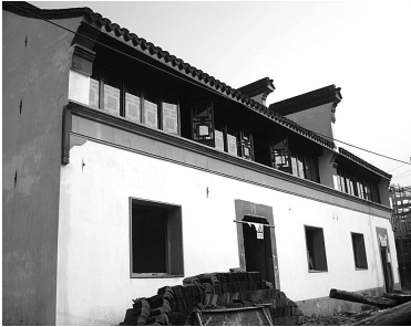
正在修建中的沈家本纪念馆

临水而建的沈家本纪念馆，依然保留着清代江南建筑的典型风格。目前，近 2000 平方米的房屋已经修缮完毕，进入了最后的陈列布展阶段，预计明年就可以开馆迎客。 就在不久前，由湖州市检察学会负责的沈家本纪念馆布展方案课题组，已经完成了布展大纲的设计，并得到了专家组的论证认可。今天，本报将独家披露纪念馆的几大亮点，让读者一睹为快。 根据设计，在纪念馆正门前的户外小广场，将会出现一个神秘的动物塑像，象征公平正义。什么动物有此寓意？答案就是獬豸。在中国古代法律文化中，獬豸这种独角神兽能够辨善恶忠奸，一旦发现有罪之人，就用角把他触倒，然后吞进肚子。这次纪念馆也设立獬豸的形象，取意于对中国传统司法精神的继承。 在馆内的瞻仰纪念区，游客只需点点鼠标，就能向沈家本坐像“献花”。这里将设置一套幻像成影的高科技系统，游客通过电脑在屏幕上进行献花的同时，沈家本坐像上也会同步显示出束束鲜花。 为了让沈家本这位学术人物走向