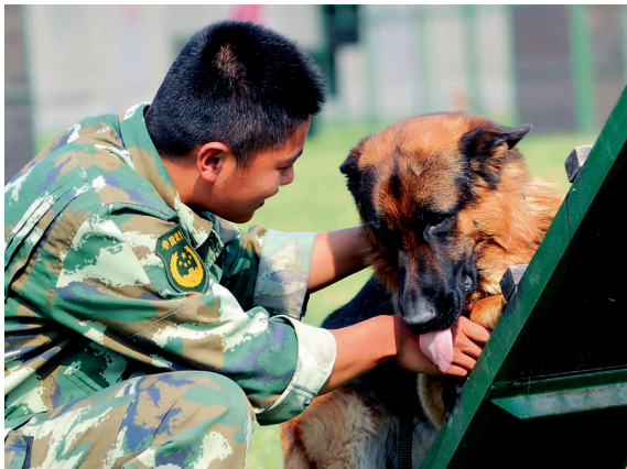
“泰瑞”害羞,训导员在做思想工作