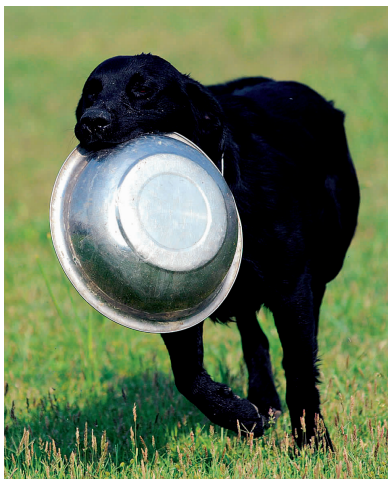
“闪电”最喜欢玩饭盆