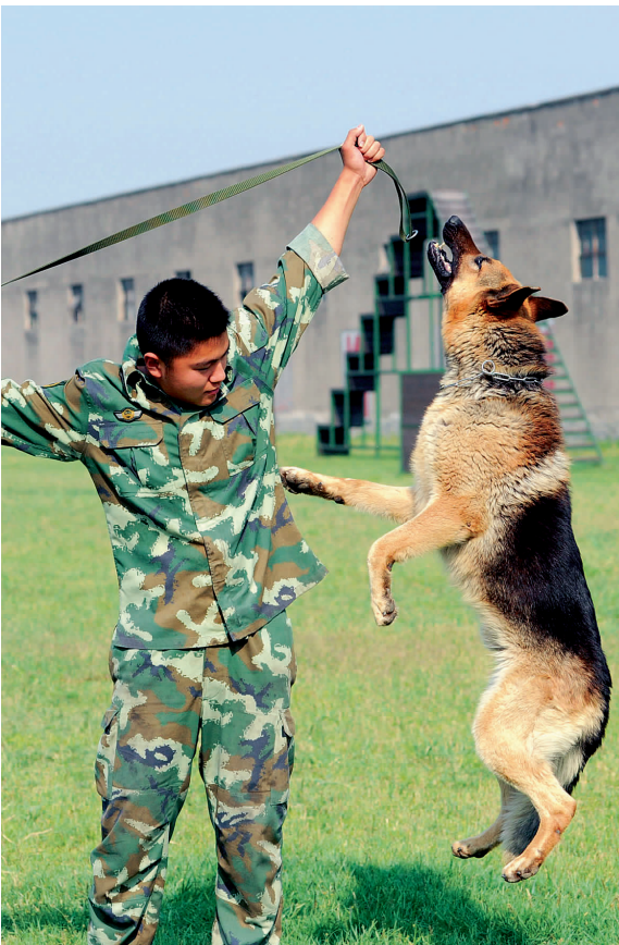
显摆一下弹跳力哦