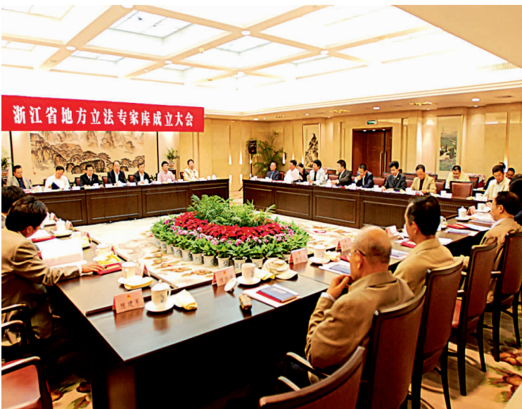
浙江省地方立法专家库成立大会