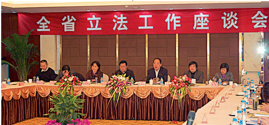
全省立法工作座谈会

截至目前,浙江省人大及其常委会通过和批准的现行有效地方性法规、自治条例和单行条例共 316 件。其中,省地方性法规 171 件,杭州市地方性法规 72 件,宁波市地方性法规 70 件,景宁畲族自治县自治条例和单行条例 3 件,为形成和完善中国特色社会主义法律体系作出了贡献,也为谱写百姓幸福生活篇章提供了强有力的法制保障。