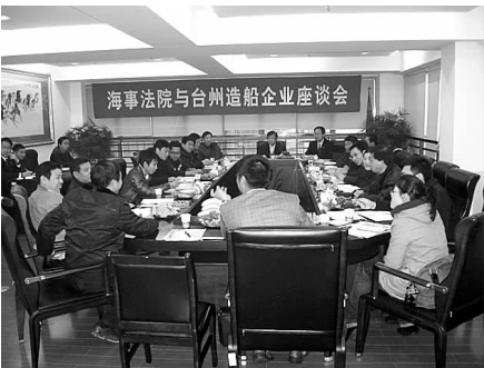
法官与台州造船企业开展座谈

据悉,近两年来,3个法庭先后自行组织调研达十余次,为当地相关部门和行业开展讲座或培训近二十场次。