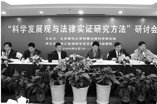
“科学发展观与法律实证研究方法”研讨会在安吉召开

成绩的取得,是对过去工作的肯定,更是对未来工作的鞭策。我们将在上级检察机关和县委的领导下,围绕检察工作主题,以追求公平正义为己任,认真履行法律监督职能,使各项工作迈上新的台阶。