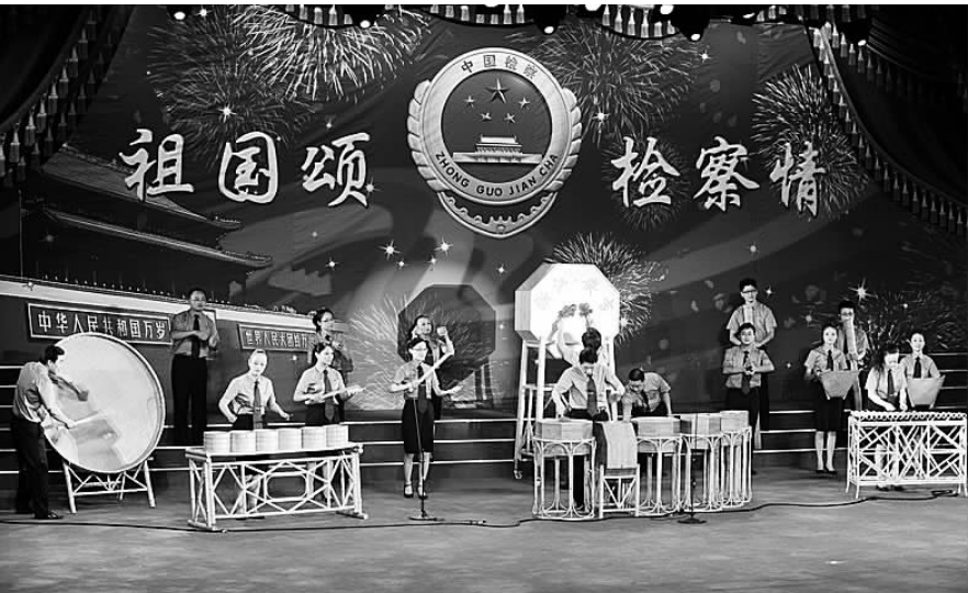
安吉检察官京城演奏华彩乐章

安吉检察院民行科在办案中主动融入“大调解”格局,推行和解优先。对执行阶段的当事人申诉案件,引入和解机制,努力促成双方当事人息事宁人,以最大限度化解矛盾纠纷,消除社会不稳定因素。