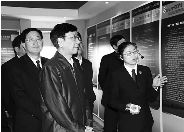
最高人民检察院曹建明检察长参观安吉检察院廉政警示教育基地