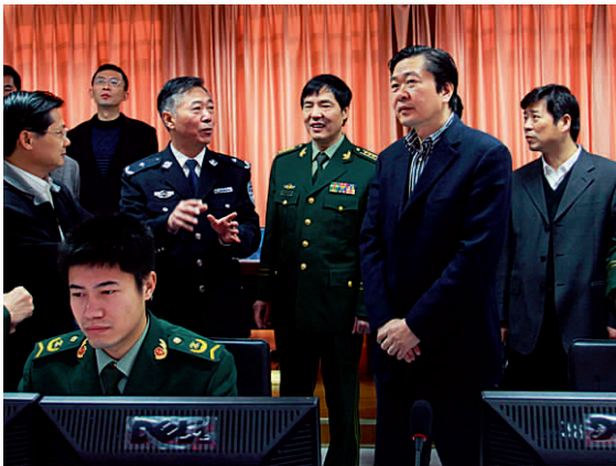
市委副书记、市长尚清视察武警消防指挥中心

“五个指头”捏成一个“拳头”,才能真正发挥力量。为此,衢州致力于健全“大维稳”机制,组织领导不断加强。五年来,各级党委、政府和主要领导牢固树立“稳定是第一责任”的理念,着力健全维护稳定的制度、机制,认真执行信访、综治、维稳、安全生产等四个责任制,全面开展各系统各行业的平安建设,把维护稳定的责任分解落实到各地、各部门、各个岗位和每个人头上,从而凝聚起平安建设的合力。 为了让“大维稳”机制真正发挥作用,市委、市政府加大了保障力度,根据工作需要增设机构,增编增员,逐年加大经费投入,已连续5年对政法部门给予每年400万元的科技强警经费补助。同时,广泛开展平安志愿者行动,法制进校园、平安综治宣传月、平安建设漫画创作大赛等宣传活动,在全社会营造起良好的创平安保稳定氛围。