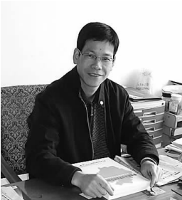
浙江省委党校法学教研部主任 林学飞