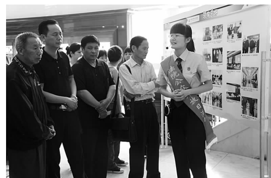
台州中院举办法院开放日活动

同时,台州中院坚持主动向市人大常委会汇报工作部署和重大案件审判、执行情况,以及每半年度的工作汇报,自觉接受人大的监督;坚持开展每年6次以上的“公众开放日”活动,邀请干部职工、社区居民代表走进法院旁听庭审,参观法院公共设施等,使法院自觉接受社会公众监督,增强沟通实效。坚持新闻发布会制度,2005年以来,中院先后组织召开10余次新闻发布会,就知识产权、行政审判等情况向新闻媒体作了发布。台州中院丁铨院长还做客“浙江在线”等新闻网站,与网民直接对话,更广泛地听取群众意见建议。