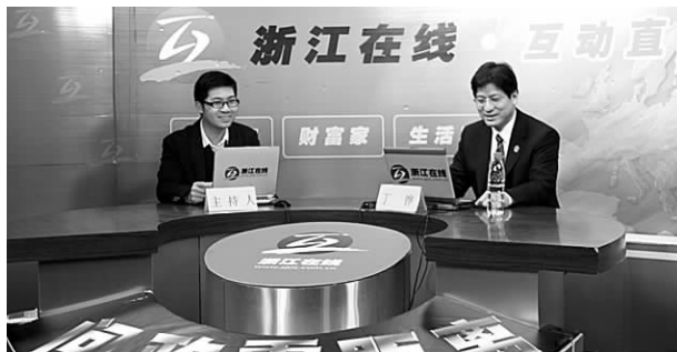
台州中院院长丁铨(右)和网民在线交流

近年来,台州市两级法院深入开展“人民法官为人民”主题实践活动,认真落实“八项司法”,全面推进“社会矛盾化解、社会管理创新、公正廉洁执法”三项重点工作,工作亮点频现,奏响了司法为民的乐章。