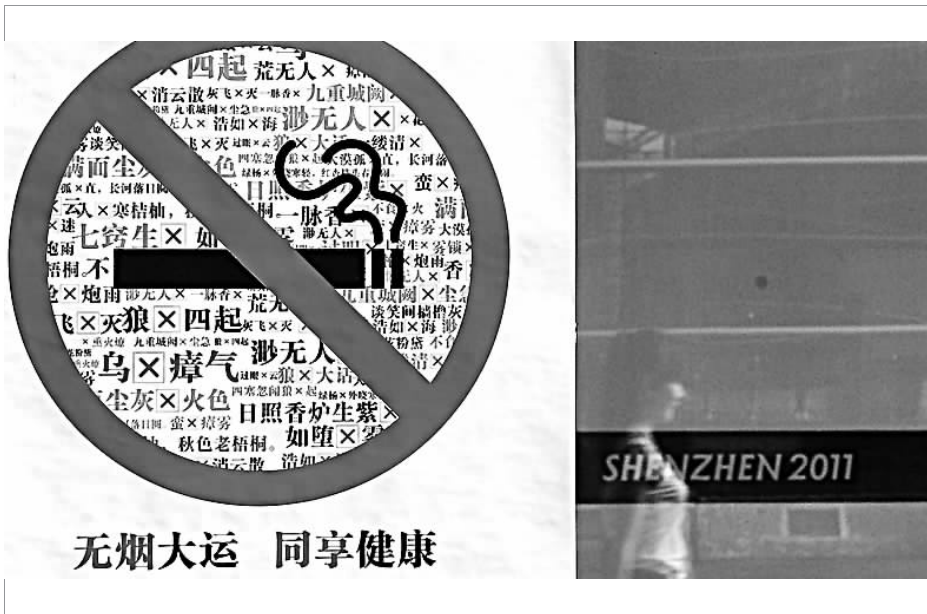
无烟大运 同享健康

“父母离异、本人残疾”,这些字很刺眼。而它们,被甘肃兰州市一家准备资助9名贫困大学生的单位公布在了一家媒体上。资助者伸出援手值得肯定,但方式方法的不妥会让结果和本意走得太远。真正的情义,不仅是金钱的无偿给予,更是发自内心的尊重和慰藉。