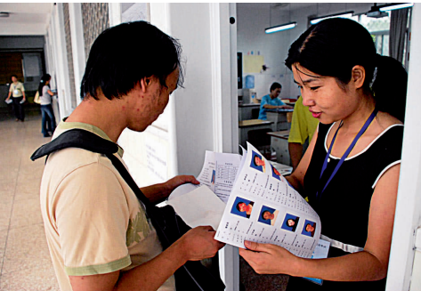
仔细核对考生信息把好评考场“进门关”