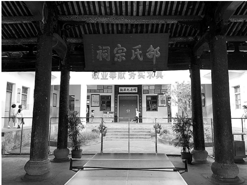
东阳唯一一所祠堂小学