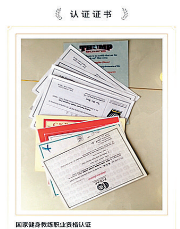
在某App上,一个教练晒出了自己多达9种的健身教练资质证书