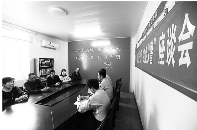
召开“红都义警”座谈会

近年来，山门派出所坚持“警力有限，民力无穷”理念，发动党员、群众组建“红都义警”，以村居为基本单位，通过定点巡、联动巡、交叉巡的多种方式开展巡逻，有效解决了山区交通不便、警力不足的问题。同时，派出所将群众威信高、社会关系好、善于调处纠纷的党员群众发展为“红心调解员”，整合建立“红心调解”组织，并制定分类分级矛盾纠纷