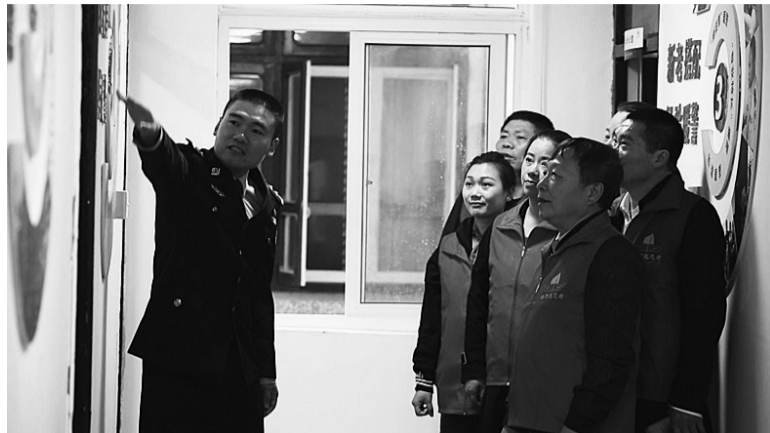
组织培训平安志愿者队伍

在山门派出所每月召开的“红都义警”会议上，来自各村居的党员、群众代表积极发言，对当月山门派出所警务工作提出意见、畅谈建议。