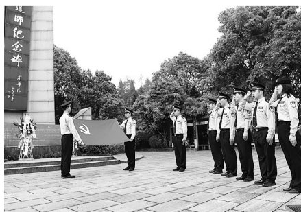
接受“红色文化”熏陶

“我宣誓，我志愿加入中国共产党……”每月20号，是山门派出所的党员固定活动日，全体民警在红军挺进师纪念碑前重温入党誓词。“如今，红色基因已经融入山门派出所每个民警的血脉，成为‘对党忠诚、服务人民、执法公正、纪律严明’的深厚底色和本色。”山门派出所的民警们说。