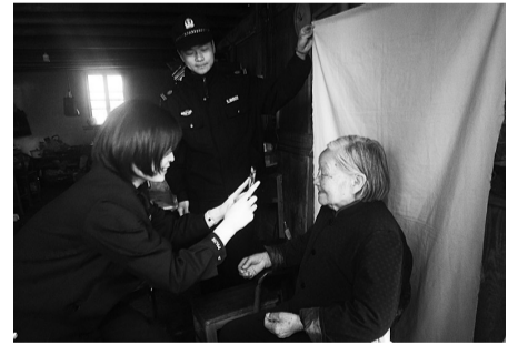
上门为老人办理身份证件

“随着平安志愿者队伍的不断壮大，由‘红都义警’‘红心调解’‘红警驿站’组成的‘红都平安联盟’发挥着越来越大的作用。”山门派出所负责人说。