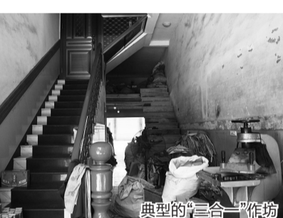
典型的“三合一”作坊