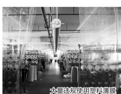
大量违规使用塑料薄膜

据了解,针对检查中发现部分隐患单位整治进度不快的问题,省消防救援总队将要求当地消防救援部门加大监督检查力度,特别是一些“老大难”问题和整治过程中容易出现的动态隐患,要采取积极上门指导和隐患露头就查的工作作风。