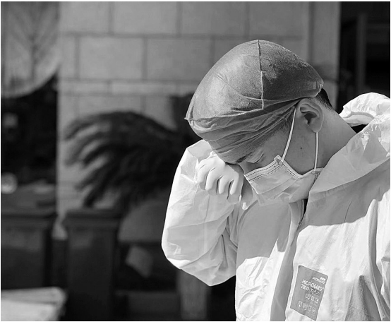
许多在医学集中隔离点执勤