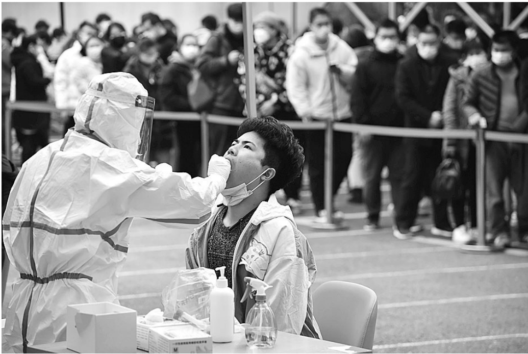
1月31日,春节越来越近,杭州一检测点,等待核酸检测的人排起了长队。预约到这里做核酸检测的,从前一天的1000多人突然增加到3000多人。采样只需半分钟时间,但排队需要1小时。