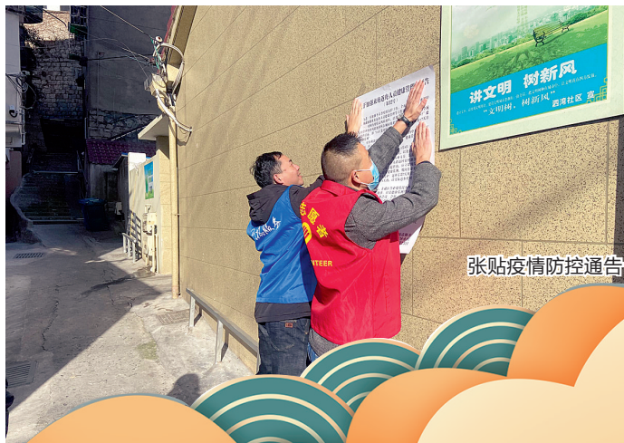
张贴疫情防控通告