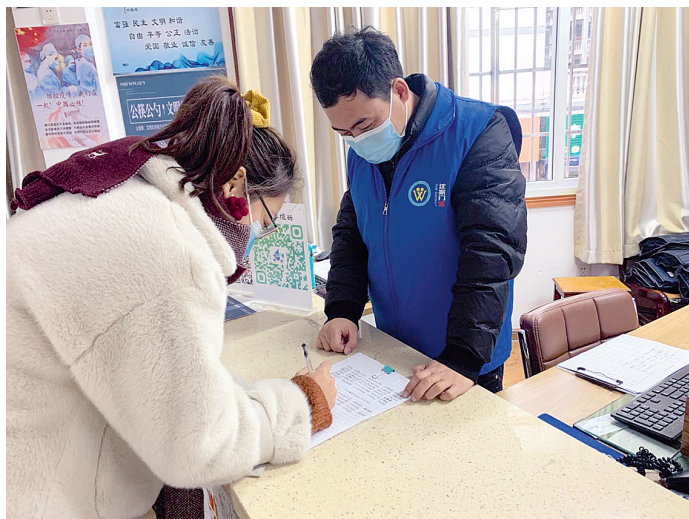
返舟人员登记信息