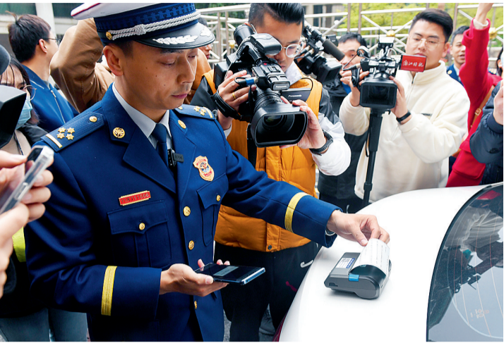
本报记者 陈立波 通讯员 林云航 孙娜

本报讯 消防通道是生命通道,以往,一些车主或许会心存侥幸,觉得临时停一下“问题不大”,但这种坏习惯以后可要改一改了。3月18日上午,杭州市消防救援支队在萧山区开展小区生命通道贴单式违停执法的全省试点工作。 当天上午,记者跟随消防执法人员来到北干街道绿茵苑小区执法。居民沈大姐告诉记者,小区的品质和整体环境不错,但美中不足的,是停车难问题一直无法解决。地面部分道路虽然画有停车位,但远远无法满足业主需求。 在小区9幢居民楼边的道路上,一辆绿色面包车停在消防车道上,执法人员立即将车辆车牌号、违停地址等信息,录入移动执法系统,并现场拍摄下图片。 很快,系统自动生成并打印出责令改正通知、违法告知单等,同时通过短信和电话等方式,将违法信息通知车主。“如果车主没有在