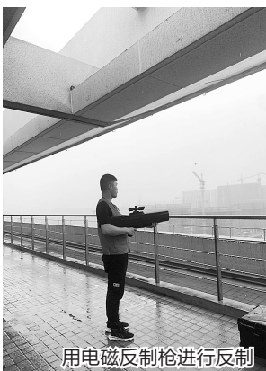
用电磁反制枪进行反制

本报讯 近年来,无人机在给社会各行业带来便利的同时,黑飞等事件对低空空域安全及社会治安稳定带来了极大的挑战,无人机反制已成为世界性难题。为检验全省公安特警无人机反制领域的真实水平,省公安厅巡特警总队4月12日、13日在台州湾新区(通用航空“万亩千亿”新产业平台)举办全省公安特警无人机反制“红蓝对抗”活动。 本次城市场景模拟对抗实测方式是在全省乃至全国范围内的一次全新尝试,活动从侦测、无线电信号反制、物理打击等三个方面展开。记者从现场了解到,“红蓝对抗”分台州、绍兴两个片区举行。其中台州站为首站,模拟区域警卫安保任务场景,台州特警支队为进攻方,驾驶各类型无人机对核心安保区域发动进攻;其他支队为防御方,采用侦