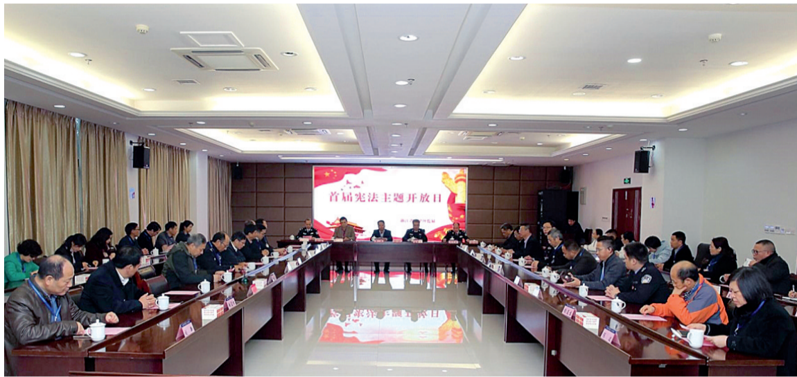
举行开放日,接受社会监督

此外,监狱还建立了公开反馈制度,向罪犯公开反馈理由,稳定罪犯改造情绪,鼓励积极改造。例如,对拟假释罪犯但未能通过当地司法部门审前调查的进