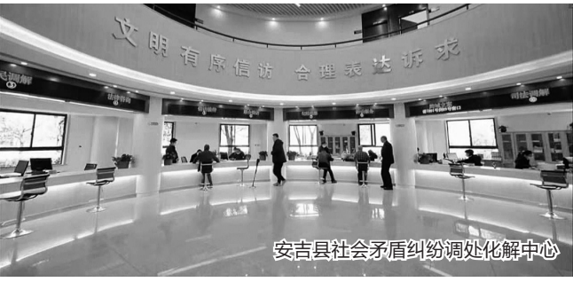
安吉县社会矛盾纠纷调处化解中心