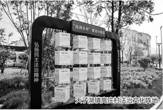
天子湖镇高庄村法治文化阵地

回首来时路,方知向何去。下一步,安吉将继续踏上法治新征程,让法治之花遍布“两山”间,为全面依法治国行稳致远贡献安吉力量。