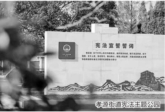
孝源街道宪法主题公园