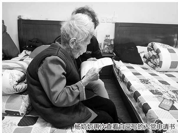
杨奶奶再次查看自己写的入党申请书

握着杨奶奶的入党申请书,听了她的故事,监狱民警感动不已,“一位老人家,几十年如一日,信任党、追随党,无论最终她能否顺利入党,这都是一件很动人的事。”