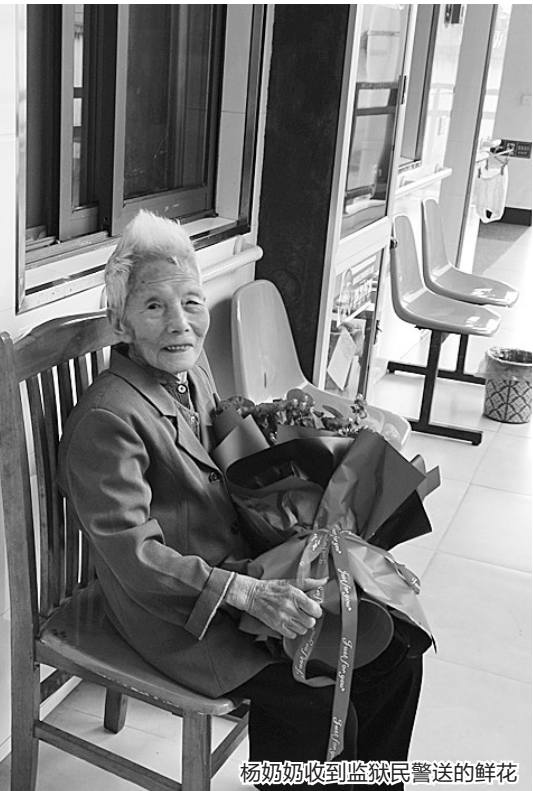
杨奶奶收到监狱民警送的鲜花