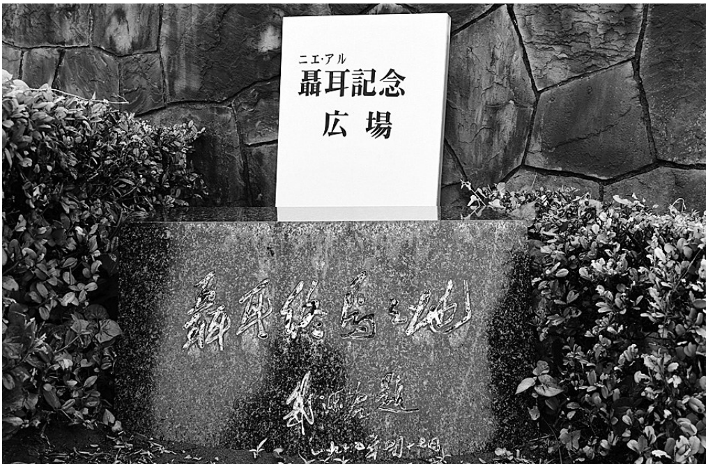
由郭沫若题写的“聂耳终焉之地”石碑