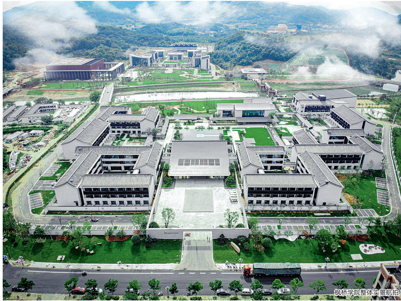
枫桥学院整体实景航拍