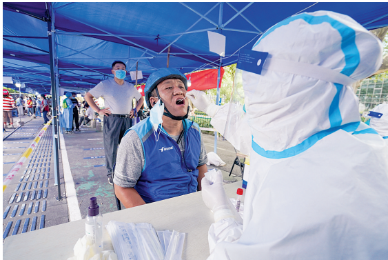
7月29日,市民在南京市玄武区新街口街道北门桥社区核酸检测点进行核酸检测取样。

记者29日从南京市新冠肺炎疫情防控新闻发布会上获悉,南京正在开展的第3轮核酸检测,将按照风险地区等级实行差异化采样检测。 目前,南京正在分区、分时段开展第3轮全员核酸检测工作,检测范围为全市范围内全部居民,含暂住人员。本轮筛查采用直接扫描身份证的简便方式进行身份登记,未成年人可关联直系亲属的身份证登记检测。 “多轮大规模核酸检测,是为了尽快把潜在人群中的感染者找出来,跑赢病毒,请市民多理解支持。”南京市卫健委副主任杨大锁在发布会上说,南京对不同风险地区的人群实行差异化核酸采样检测,高风险地区实行单检、中风险地区1:5混检、低风险地区1:10混检。 29日起,南京部分区域疫情风险等级再次调整。江宁区禄口街道全域被调整为高风险地区。禄口街道围合区域,禄口街道石埭村,禄口街道白云路社区、茅亭社区、机场社区、永兴社区和永欣新寓所在的连片区域,禄口街道铜山社区和谢村社区所在的连片区域,不再单独设为高风险地区。禄口街道曹村村张家自然村、欢墩山