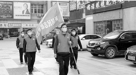
数字化沙盘也接入了社区联勤警务站

“娄桥派出所巡逻1组,接到群众报警,吹台公园附近发生一起儿童走失警情。”7月6日晚7时50分许,一条警单出现在瓯海公安分局指挥中心的数字化沙盘内,指挥长