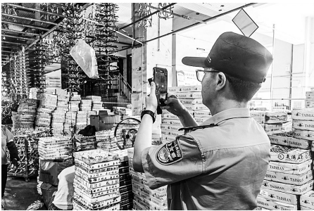
社区民警应建设拿着警务通在瓯海电镀业园内“打卡”

目前,数字化沙盘已覆盖瓯海所有派出所综合指挥室,进一步发挥出“小脑”中枢的最大效能,同时还接入了社区联勤警务站,有效发动保安、义警等社会群防群治力量参与治安巡防和就近接处警,让群众的安全体验更快更直接。