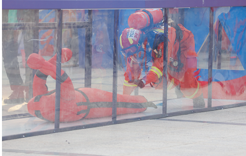
被困人员救援比武